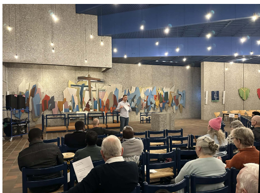
Fredag i Vollsmose Kirke